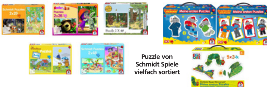
Puzzle von Schmidt Spiele vielfach sortiert

Es wartet eines von drei tollen Geschenken in der Weltsparwoche auf dich. Wann in deiner Filiale die Weltspartage sind, erfährst du unter www.sparwoche.vr-rg.de