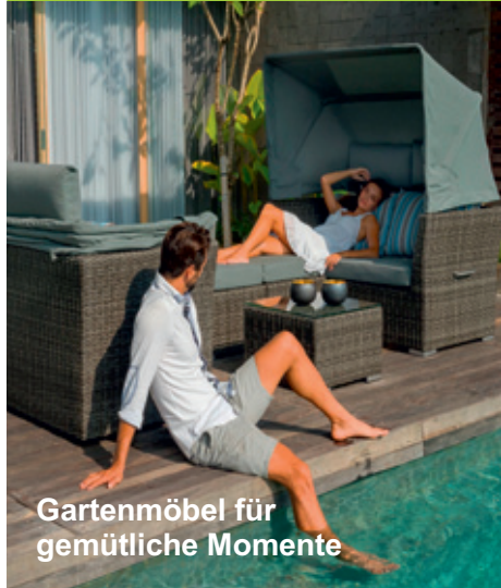
Gartenmöbel für gemütliche Momente