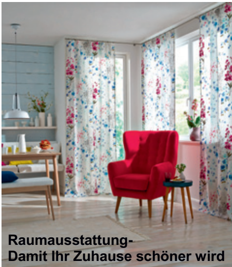
Raumausstattung- Damit Ihr Zuhause schöner wird