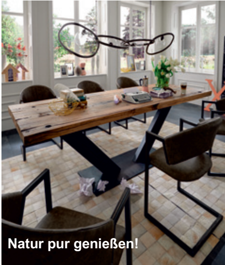
Natur pur genießen!