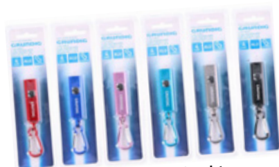
Grundig Schlüsselleuchte in sechs verschiedenen Farben