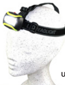
hochwertige Stirnleuchte mit austauschbarer Universalhalterung

Jeder Mensch hat etwas, das ihn antreibt.