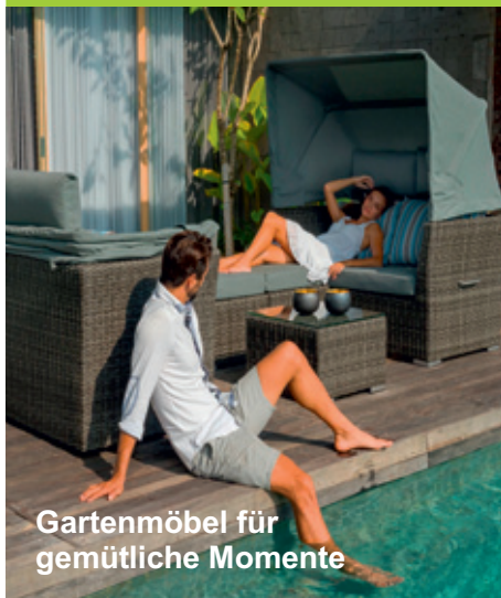
Gartenmöbel für gemütliche Momente