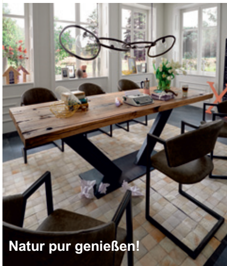
Natur pur genießen!